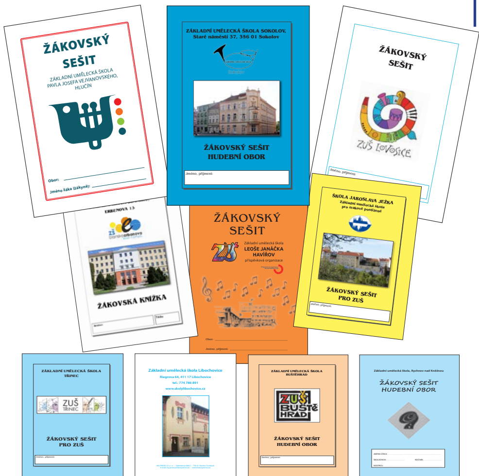
FOTO ŠKOLY NEBO LOGO, KOMBINACE FOTOGRAFIE A LOGA

OBÁLKU ŽK MŮŽETE TAKÉ DODAT VE VLASTNÍ GRAFICE, KTEROU U NÁS POUZE VYTISKNEME A ZKOMPLETUJEME S NAŠIMI VNITŘNÍMI LISTY, PŘÍPADNĚ MŮŽETE ZASLAT CELOU VYTVOŘENOU ŽK K VÝROBĚ.